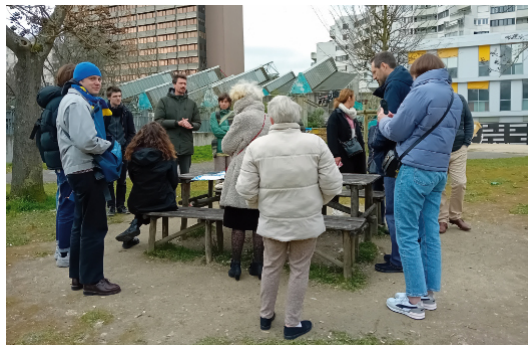
En mars 2025, un atelier organisé sur site a permis de présenter et valider collectivement les propositions faites par l'Atelier de l'Ours.

Elle vise à renforcer la végétalisation de la place, consolider les continuités écologiques et urbaines, accompagner l'émergence de nouveaux usages et pérenniser une démarche copilotée par la Ville, l'ensIIE et le CAUE 91.