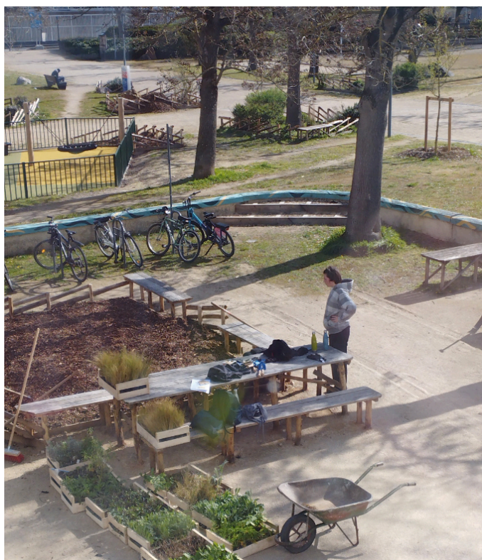
Au printemps 2026, un chantier de plantation participatif est venu compléter les nouveaux massifs fraîchement dessinés.

En parallèle de cette démarche, les étudiants du DN MADE du lycée Georges-Brassens d'Évry-Courcouronnes ont réalisé une exposition retraçant la première phase de transformation