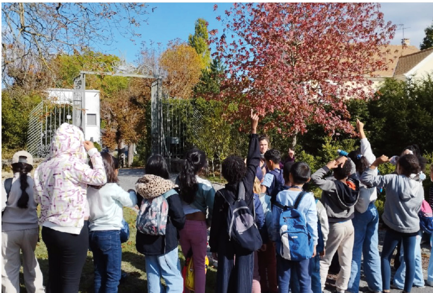
De l'école à la Seine, les élèves découvrent l'architecture et le paysage d'Évry-Courcouronnes. Action menée en 2026

Le dispositif "Levez les yeux" permet aux enseignants de faire découvrir l'architecture à leurs élèves avec l'aide de professionnels. À travers des activités variées, ludiques et pédagogiques, les élèves apprennent à mieux comprendre et décrypter les paysages urbains et ruraux qui les entourent.