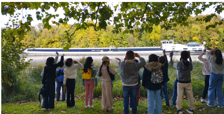
La visite prend fin au bord de la Seine : source de nombreuses questions sur son histoire !