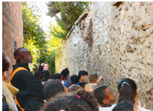
Traversée de la ruelle au jardin.