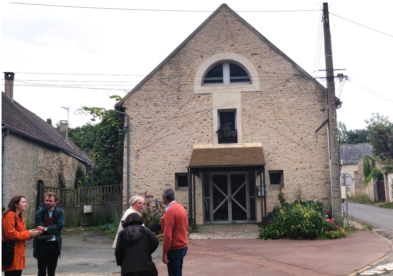
Une visite de la salle des fêtes a été organisée avec la ville, la Sous-préfecture et le CAUE. Action menée en 2024 et 2025

Le CAUE de l'Essonne accompagne la commune du Plessis-Saint-Benoist pour son projet d'extension de la salle des fêtes communale et la rénovation d'une longère agricole en cœur d'îlot.