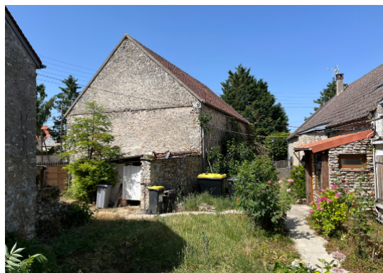
Vue sur l'arrière de la salle des fêtes, à l'endroit de la future extension.