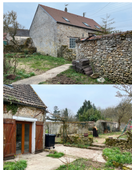
Vues intérieures de la parcelle, accès maison et jardin.

En septembre 2024 , la parcelle aux multiples jardins est en friche. La réflexion engagée sur le devenir de ce lieu s'organise autour d'une méthode et d'un calendrier mis en place par le CAUE 91. C'est aussi le moment de définir les besoins du futur équipement devant répondre à de multiples usages notamment associatifs.