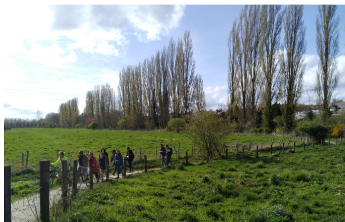
Marche exploratoire pour découvrir le territoire avec les élu.e.s et les associations.