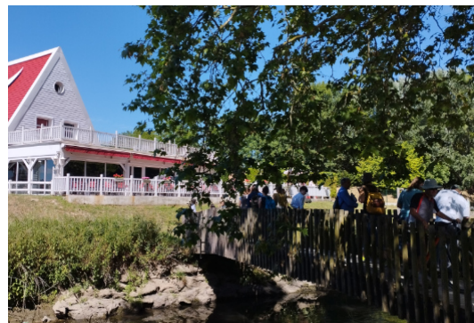
Marches exploratoires avec des élu.e.s et des associations, en 2022.

Pour mener à bien celles-ci, le Plan de Paysage est identifié comme un outil pertinent. Le CAUE de l'Essonne accompagne sa mise en place sur le terrain.