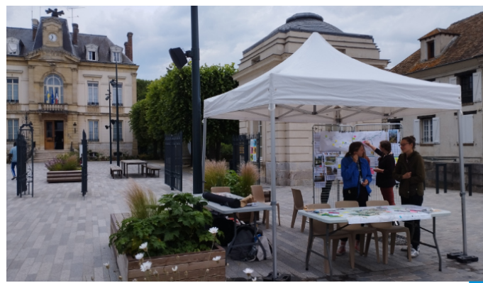
Forum citoyen pour aller à la rencontre des habitants.

La première étape est la réalisation du diagnostic. Plusieurs types d'ateliers sont menés par la maîtrise d'œuvre avec l'appui de la connaissance de terrain du CAUE. Trois marches exploratoires sont organisées à destination des élus du territoire et des partenaires du projet (DRIEAT, ENS). Elles permettent d'explorer les trois entités paysagères de la vallée de l'Orge identifiées par la maîtrise d'œuvre : l'Orge urbaine, l'Orge des lotissements et l'Orge des villages.