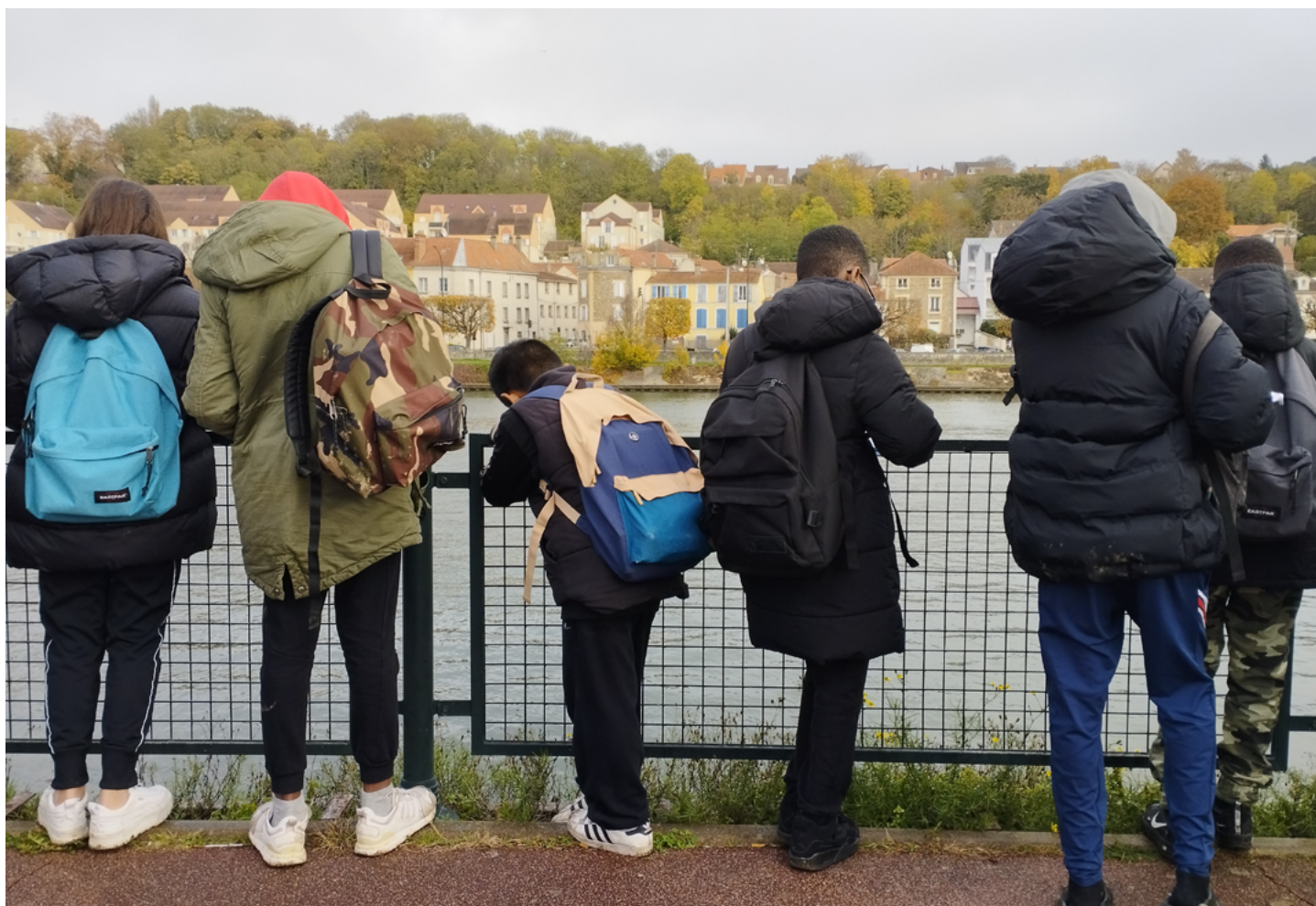
Après avoir longé l'Esbonne, les élèves arrivent au bord de la Seine et prennent le temps de dessiner les berges. Action menée en 2022.

Le CAUE accompagne les collèges Louise Michel et Léopold Senghor dans le cadre du PACTE "Corbeil-Es-son-art". À travers une balade de terrain, deux classes de 6 e sont sensibilisées à l'architecture de leur ville, et redécouvrent leur cadre de vie.