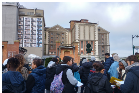
Les élèves devant les Grands Moulins de Corbeil-Essonne. Prochaine étape: la confluence entre l'Essonne et la Seine.

Le CAUE propose une visite de la ville autour de l'architecture, de la géographie, en reliant les lieux phares de la ville au Projet Artistique et Culturel en Territoire Éducatif (les Grands Moulins, le théâtre, la médiathèque, l'Essonne et la Seine). Le CAUE donnera aux élèves un support graphique à compléter durant la balade, avec des mots clés, des dessins, des questions... Ils pourront réinvestir ce support pour la suite du projet "Corbeil-Es-son-Art". L'objectif de cette déambulation est d'initier les élèves à l'observation de leur territoire.