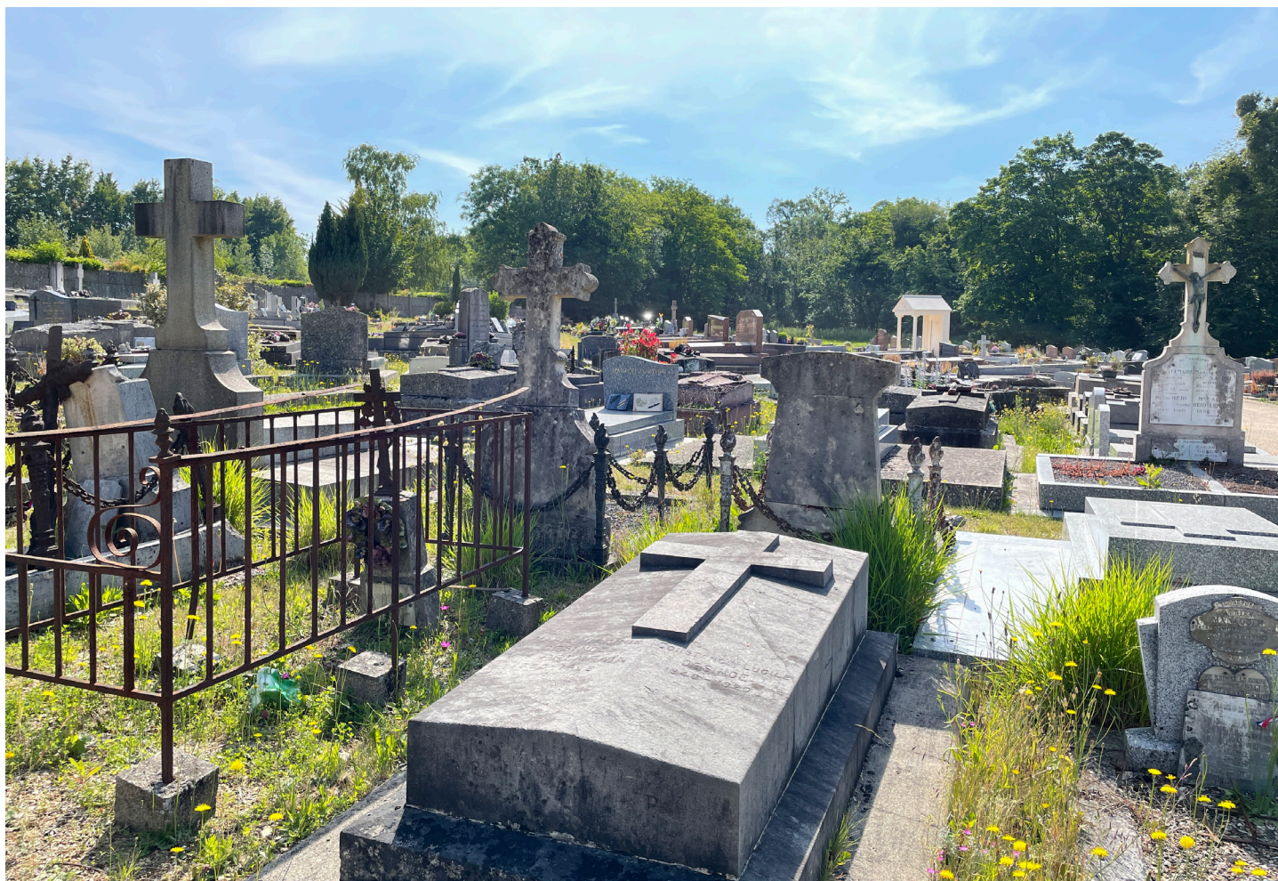
Un cimetière au cœur d'un patrimoine funéraire et du patrimoine naturel communal. Action menée en 2022.

Le CAUE de l'Essonne accompagne la ville d'Étiolles dans sa réflexion globale sur la transformation du cimetière communal et de ses abords, le bois des Coudraies. Un travail mené en étroite concertation avec les habitants.