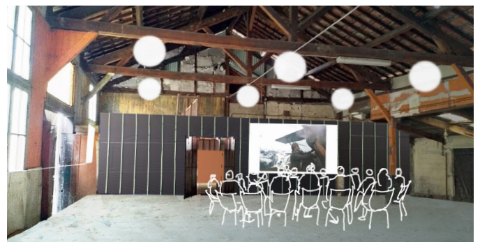
Des événements seront l'occasion d'inviter un large public.

Cette permanence et ces événements seront autant d'outils destinés à établir des scénarios, un programme, afin de basculer vers une étude et un projet de maîtrise d'œuvre plus conventionnelle.