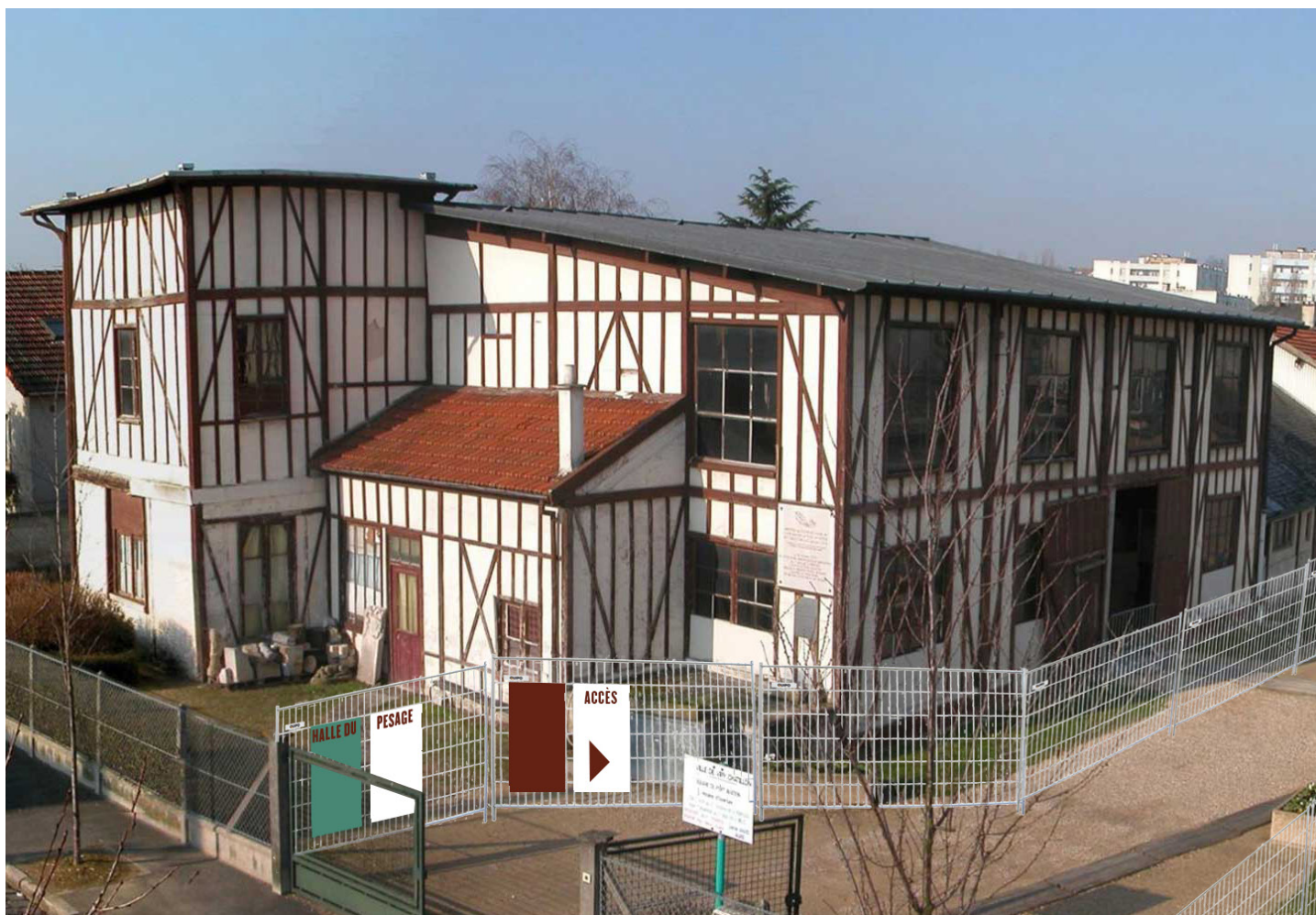
Seul bâtiment restant du premier aérodrome : le mess des officiers. Action menée en 2019 - 2020

Le CAUE de l'Essonne accompagne la commune de Viry-Châtillon pour élaborer le devenir de ce lieu emblématique des débuts de l'aviation, aujourd'hui désaffecté.