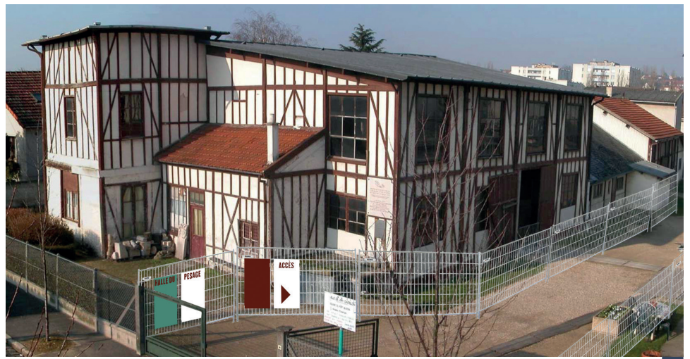
Le CAUE de l'Essonne accompagne la commune pour élaborer le devenir de Port-Aviation, premier aérodrome organisé au monde, aujourd'hui désaffecté.

Oui, mais sans connaître réellement ses missions d'intérêt public. C'est aussi cela qui nous a convaincus de travailler avec le CAUE. Bénéficier des missions de conseil, de formation et de sensibilisation du CAUE était une valeur ajoutée non négligeable dans la