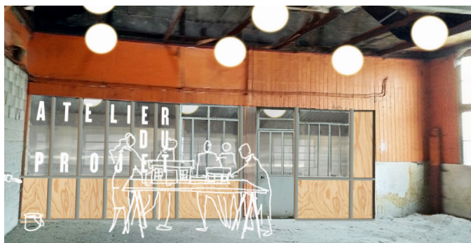
Un bureau provisoire permettra de travailler dans le bâtiment.

Dans un premier temps, des travaux d'accessibilité au public seront menés, en parallèle d'une sécurisation de la structure des charpentes, devenue dangereuse.