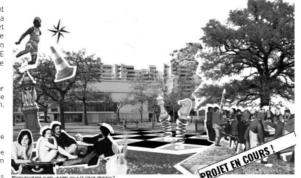
Photomontage d'usages pour la place de la Résistance.

Des ateliers visio sont mis en place pendant le confinement : enquêter sur la place, analyser son contexte, son architecture, son paysage, ses usages... imaginer des scénarios d'évolution selon les besoins révélés. Une architecte et un paysagiste du CAUE animent les ateliers, posent les questions et propose des méthodes pour faire émerger un projet. À ce jour environ 15 personnes participent aux ateliers, des élèves, du personnel, des enseignants chercheurs, le directeur.