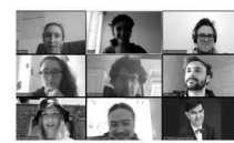
Participants d'un atelier visioconférence

Le CAUE en collaboration avec l'école prépare pour la rentrée, un café voisin : une présentation publique et conviviale des idées, pour partager sur le projet avec les voisins, les habitants et les usagers de la place. Par la suite, des ateliers avec les habitants seront organisés pour créer un mélange des envies, des idées. Ces rencontres permettront de construire un projet commun.