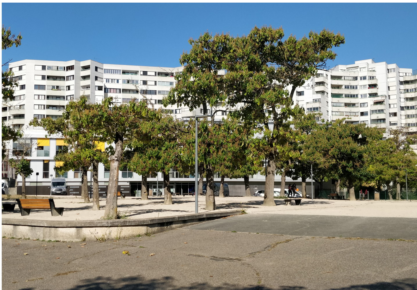
Place de la Résistance à Evry-Courcouronnes Action menée en 2019-2020

Le CAUE accompagne l'École Nationale Supérieure d'Informatique pour l'Industrie et l'Entreprise (ENSIIE) dans la réflexion sur l'aménagement de la place attenante à l'école : une place stratégique du centre-ville d'Évry-Courcouronnes.